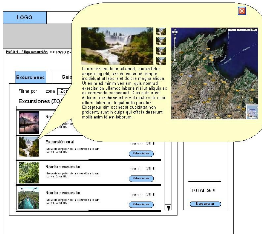
Esquema 2. Acceso a información detallada de una excursión.

Una excursión dispone de una información más completa de la que en un principio se mostraba en el listado anterior. Ésta información será accesible desde el portal.